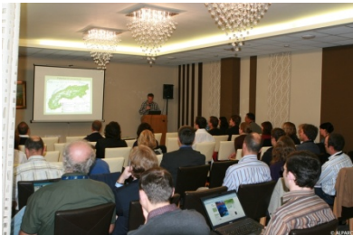
Mikulov (CZ) September 2010

Nadaljnja podpora izvajanju Memoranduma o sodelovanju